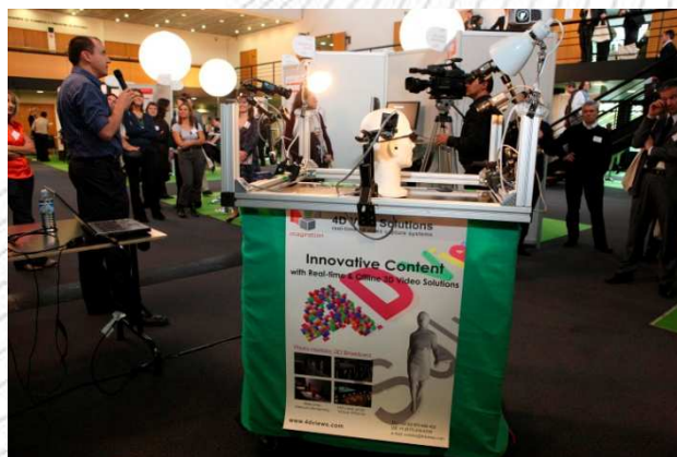
Démonstration de la technologie proposée par la société 4D Views