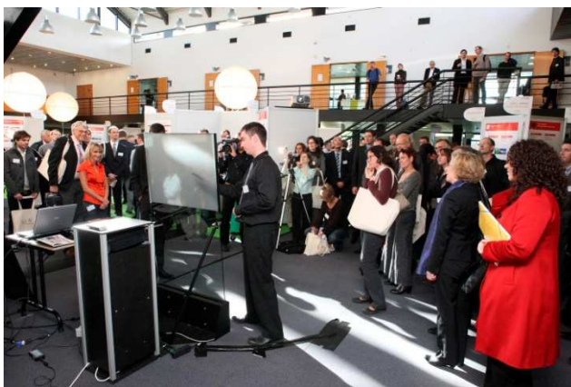
Prix de la Meilleure Démonstration : HILABS