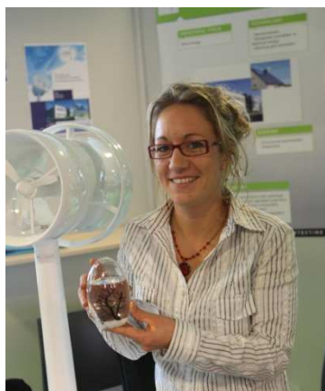
Prix de l'Innovation Verte : ELENA Energie

Fort du succès de cette première édition, les organisateurs, GRAIN, GRAVIT et PETALE, ont d'ores et déjà annoncé la reconduction de l'événement pour 2010.