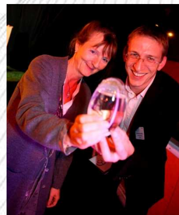
Prix de l'Innovation Citoyenne : PLANETINNOV & RC LUX